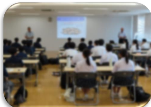
加東市人権ジュニアリーダー学級 (後期課程 7年、8年、9年)