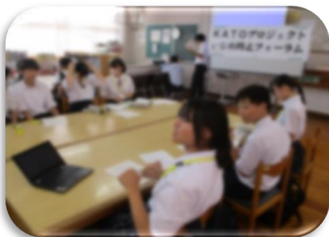
KATO いじめフォーラム参加 (学園会中央委員)