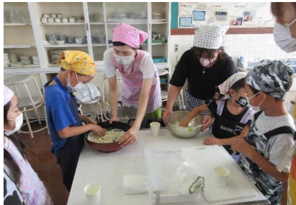
手作りのもち麦うどんの味は格別でした