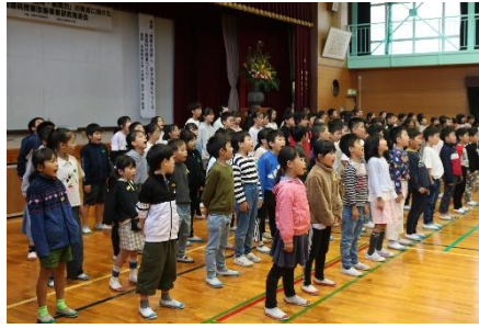
国語科研究発表会 詩の群読