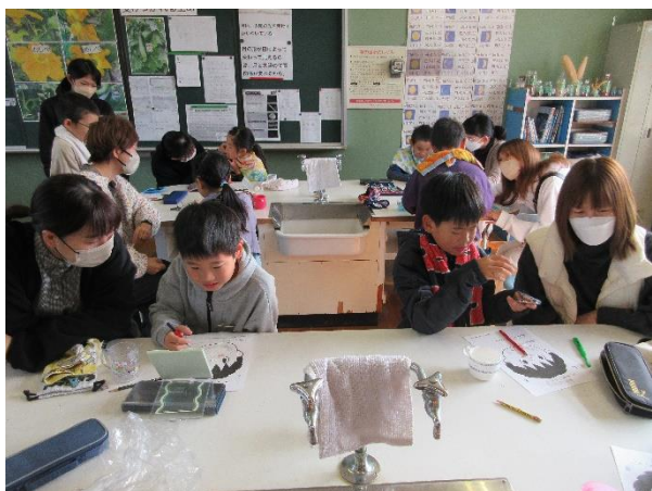
ブラッシング指導で歯の磨き方を学びました