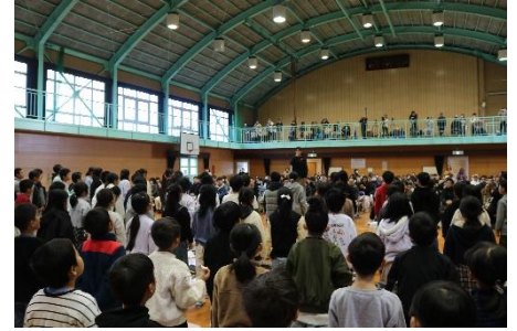
ふれあい音楽会 全校合唱

「やる」を選んだすべての子どもたちの願いが叶うわけではありませんが、「挑戦しよう」と挙手した時点で子どもは成長していると感じます。その証拠に、一度「やる」を選んだ子どもは、その後も「やる」を選び続けています。また、「やる」を選ぶことは、全力を発揮することにつながっています。立候補で選ばれた子どもは、周囲の子どもに自分の全力の姿を見せることが暗黙のマナーになっています。また、「やる」を選ぶ子どもが増えることで、個の成長が集団の成長へとつながっています。