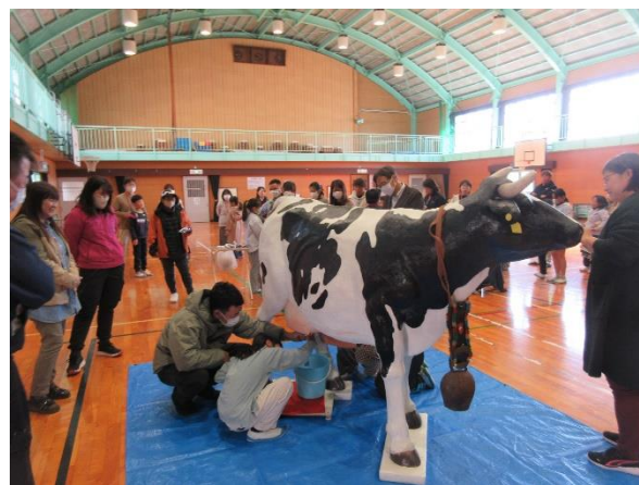
はじめての搾乳体験、上手にできました