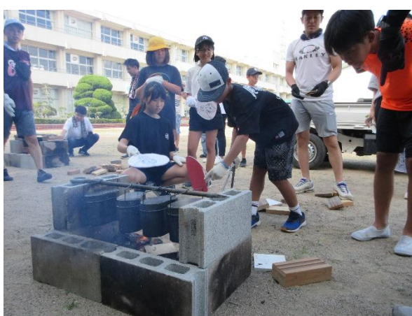
親子で力を合わせて飯盒炊飯をしました

冬季休業中の緊急連絡先 12月24日(火)～27日(金) 1月6日(月) 学校へ 年末・年始の電話対応先 12月28日(土)～1月5日(日) 加東市役所学校教育課へ