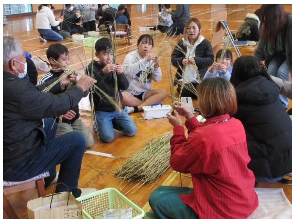
地域の方からしめ縄の作り方を教えてもらいました