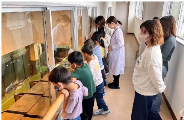
大きなお鍋としゃもじにびっくりしました