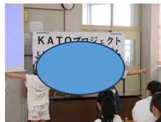
南小あいさつ運動紹介