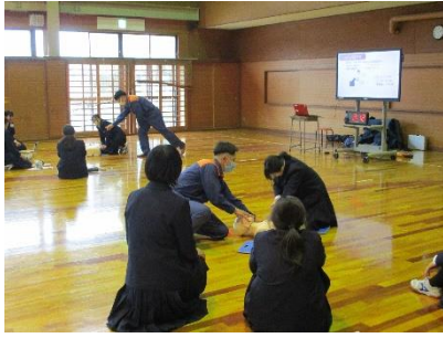
【加東消防署:2年心肺蘇生講習会】