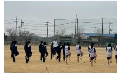
【かとう夢授業:スポーツトレーニング】

3年生が美術の時間に読書活動と連携して作成した「本の帯」を滝野図書館で掲示していただきました。