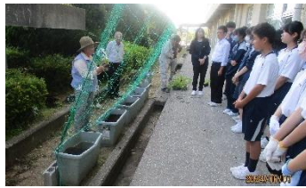
【加東エコ隊 ゴーヤカーテン】