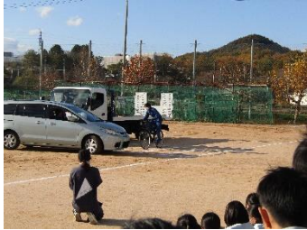
【スケアードストレイト交通安全教室】